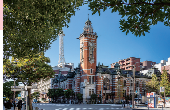
横浜市開港記念会館(ジャックの塔)